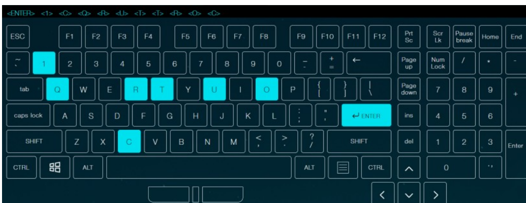
LOWER CASE MODE (Lectura: cortturqc1)