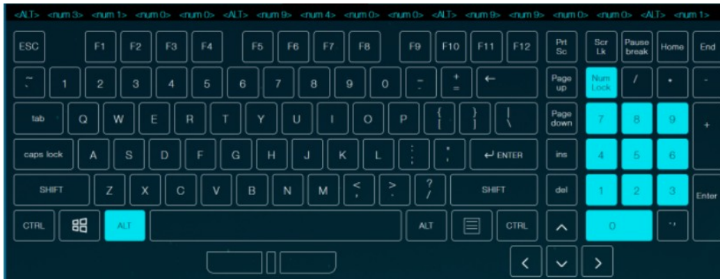
ALT MODE (Lectura: CORTTURQc1)

En este caso este código al tener una letra minúscula ("c"), causaba que el lector presione "Shift+c" lo que accionaba un atajo de teclado (shortcut) en Zeus. A continuación dejo capturas de lecturas realizadas con diferentes modos donde se puede apreciar las teclas presionadas.